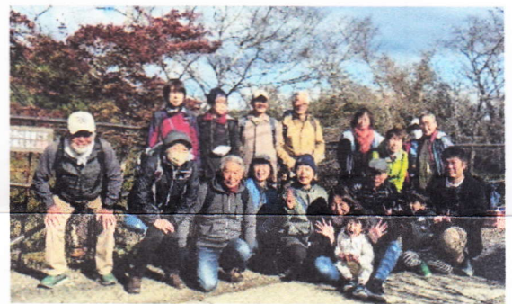
11/11 秋保木の家での芋煮会。