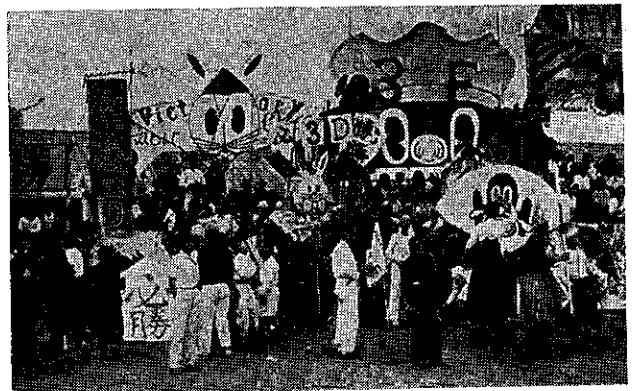
体育祭応援風景 一昭和26年 校庭で二

① 阿倍野高校 ② 大阪市立文部学校三年 ③ 授業時間は有効に使う。理科、社会は特に理解しながら聞く。英語、数学は数多くの問題にあたる。教科書中心で参考書はほんの補充にしておく。④ つれづれ運動してはならない。勉強の中心は興味をひき出す事が大切で、興味のない科目は最低限の知識を身につけておく。勉強の中心は興味をひき出す事が大切で、興味のない科目は最低限の知識を身につけておく。⑤ 一年の時給小生の購買で学芸会のようなものが開かれた。二年の時、校舎を改装したの自分のクラスに分けて他のクラスの人も入ったけれども、そのクラスの人数から親切にされてうれしかった。⑥ 就職、進学を勉強の上から分けるのはよい。行事を知らせるために、同窓生用の新聞を発行して欲しい。