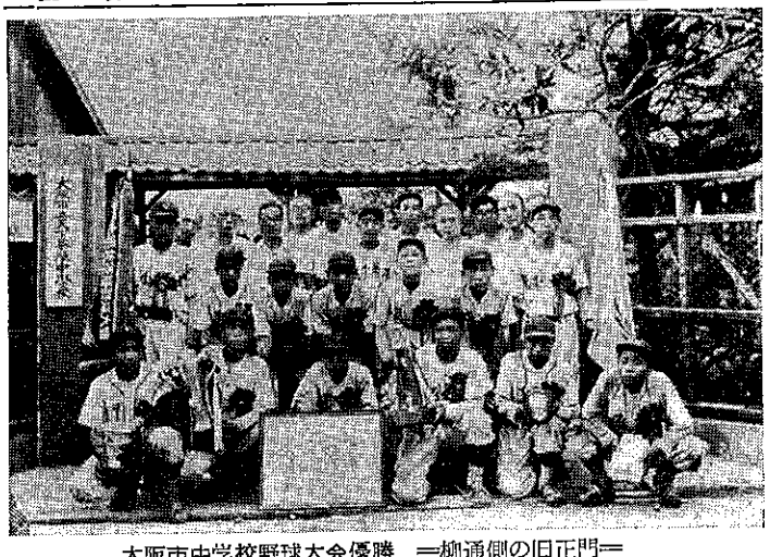
大阪市中学校野球大会優勝 一柳通側の旧正門一

① 今宮高校 ② 神戸大学工学部二年 ③ 教科書をよみ暗記で完全に習得すること。④ 参考書は教科書の補充程度にする。⑤ 校舎は鉄筋校舎が一種だけだった。当時の学校新聞は先生の書かして欲しい。