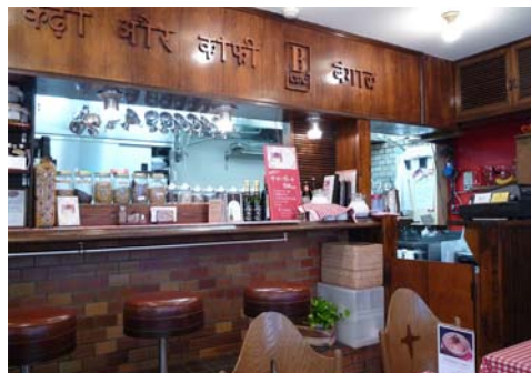
カレー専門店だから、カレー(写真右上 デラックス カレー)を載けるが、最近ではカレー粉末(写真左上1500円)のみを買って帰る。